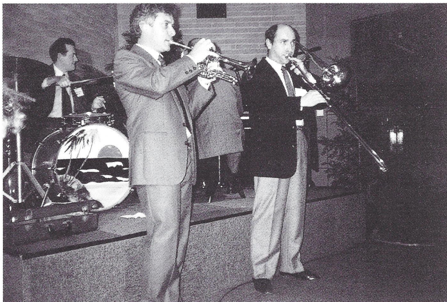
90 ans de l'École : arrivée en fanfare.